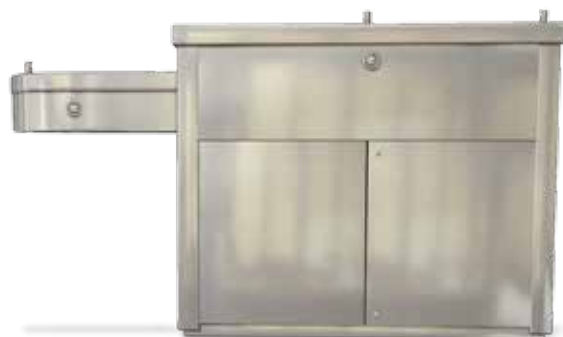
Tabla de alturas